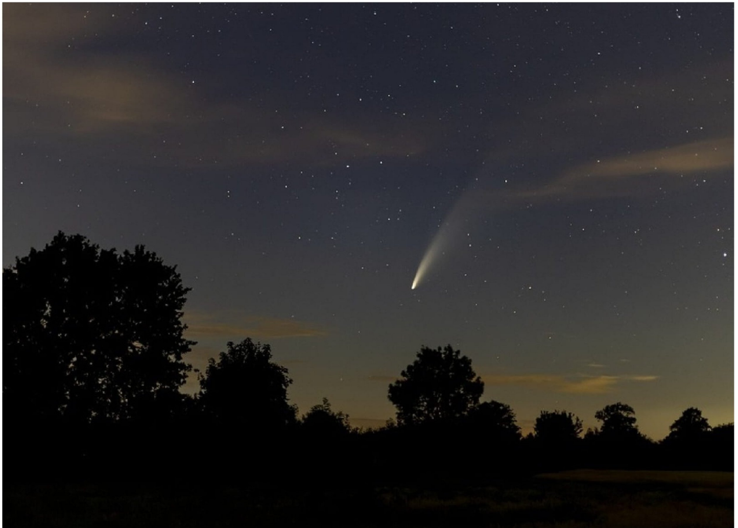
► Los especialistas también explican que los mejores lugares para observar este y otros cometas van a ser siempre lugares que tengan la vista despejada hacia el este.