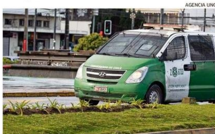
LA DELINCUENCIA ES EL MAYOR TEMOR DE LA REGIÓN.

respecto de la elaboración de políticas regionales frente a materias que preocupan a la población.