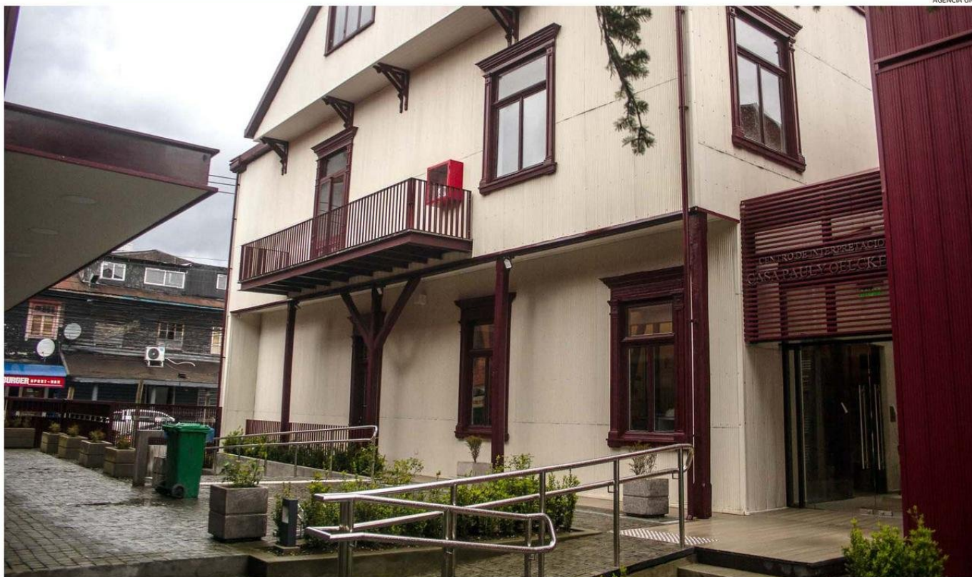
CONSEJEROS REGIONALES Y AUTORIDADES DE LA DIRECCIÓN REGIONAL DE ARQUITECTURA REALIZARON AYER UNA VISITA TÉCNICA A LA REMODELADA CASA PAULY, UBICADA EN EL CENTRO DE PUERTO MONTT.