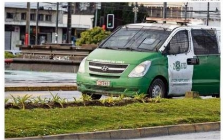
LA DELINCUENCIA ES EL MAYOR TEMOR DE LA REGIÓN.

En su intervención, señaló que los antecedentes dados a conocer por este estudio, "nos