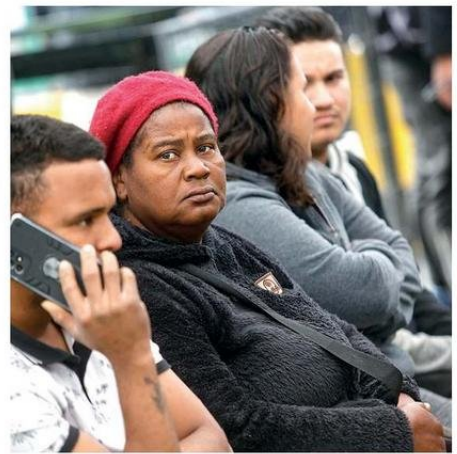
LA REGIÓN CONCENTRA CASI 60 MIL MUJERES MIGRANTES.

Este fenómeno de la baja natalidad chilena se ha ido