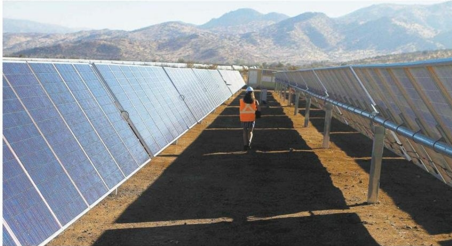
LA PRODUCCIÓN DE ENERGÍA AUMENTÓ EN LA REGIÓN, IMPULSADA POR NUEVAS PLANTAS ELÉCTRICAS Y DESACOPLA DE LA BAJA DEL PIB.