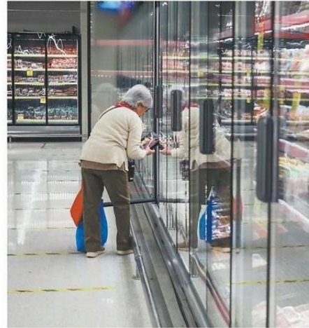
MIENTRA EL PIB REGIONAL BAJÓ EL CONSUMO DE LOS HOGARES SUBIÓ.

“Atacama depende del cobre mucho más que el promedio del país, es la región clave que depende del cobre, mucho más que las otras regiones de Chile y eso hace que tengamos estos ciclos muy volátiles de alzas muy grandes o disminuciones muy grandes, como en este caso”, cerró el econo-