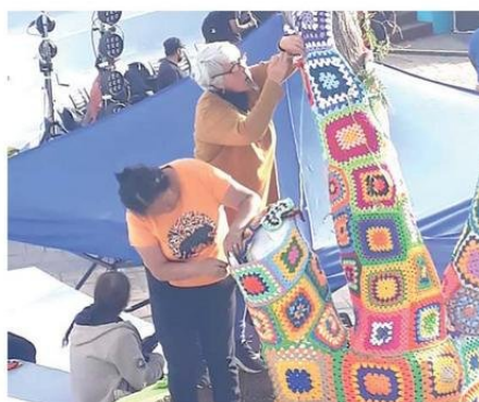
SE ADORNARON LOS ÁRBOLES DE LA PLAZA CARLOS CONDELL.