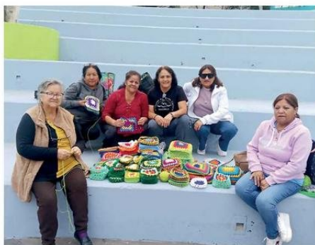
MUJERES TOCOPILLANAS EN INTERVENCIÓN EN LA PLAZA CONDELL

El objetivo de esta organización es visibilizar el borde costero, el esfuerzo de sus mujeres y proyectar la artesanía local como una expresión que ponga en relevancia el arte femenino construido en las ca-