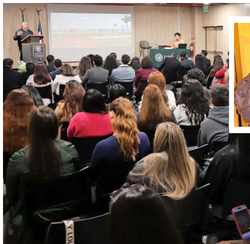
La ceremonia se realizó en el auditorio de Santo Tomás Antofagasta.