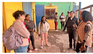
Durante la jornada se visitó el campamento “La Chimba” donde viven muchas personas de Buenaventura.