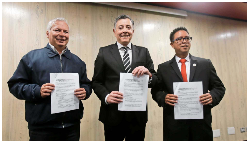
Autoridades de la Universidad Santo Tomás y Universidad del Valle (Colombia) firmaron el mérito convenio.