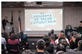
El Programa de Salud Comunitaria se imparte en todas las facultades de Salud de la UST, de Arica a Puerto Montt.