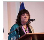
La autora española, al inaugurar el XXV Congreso Mundial de Mujeres Periodistas y Escritoras.

La creciente escalada entre Israel y Hezbolá amenaza con transformarse en un conflicto regional en Medio Oriente. Un masivo bombardeo de las fuerzas israelíes dejó más de 490 personas fallecidas, en la mayor ofensiva desde que se reiniciaron las tensiones y en la jornada más letal que ha sufrido ese país desde la guerra entre ambas naciones en 2006. El gobierno de Netanyahu advirtió que esta arremetida podría no ser la última contra el grupo terrorista. A 4