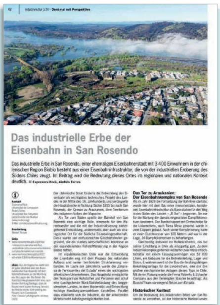
EL FACSÍMIL CON LA PUBLICACIÓN en la revista alemana de divulgación científica IndustrieKultur sobre el patrimonio industrial de San Rosendo.