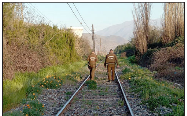
Carabineros se reportó en el lugar previo a Fiestas Patrias.