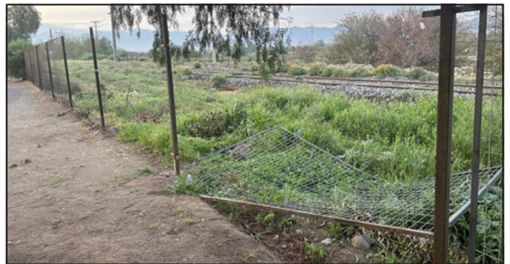
Paños sustraídos la madrugada de este sábado, junto al que no pudieron llevarse por estar adherido con cemento.