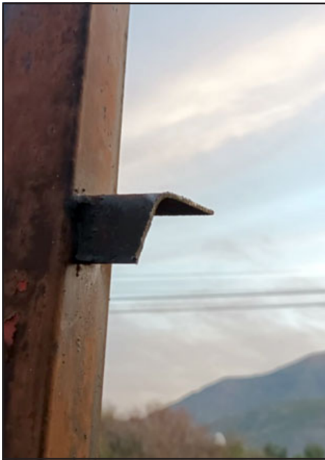
Desde la Junta de Vecinos aseguraron que en esta ocasión ocuparon una sierra para cortar los paños.

que después de las fiestas iban a venir a ver. Lamentablemente le volví a enviar la información con la fotografía de los paños que se robaron ahora, porque es una cosa que no podemos detener ni nos podemos meter más; o sea, qué más podemos hacer aparte de grabar, de avisar, de vigilar», cerró.