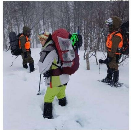
EQUIPOS DEL GOPE LOGRARON UBICAR A LOS EXCURSIONISTAS.