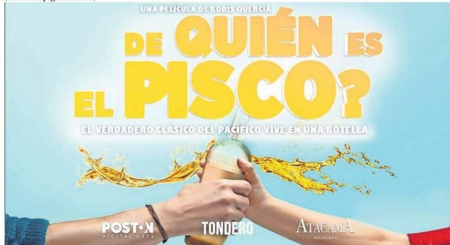
EL AFICHE PROMOCIONAL DE LA PELÍCULA QUE PRETENDE ABORDAR DESDE LA COMEDIA LA RIVALIDAD CHILENO-PERUANA SOBRE EL ORIGEN DEL PISCO.