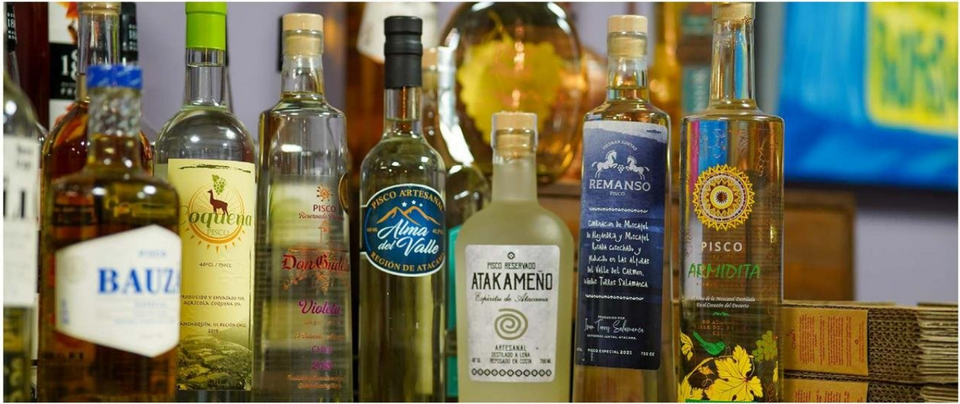
EL PISCO ARTESANAL ATACAMEÑO TENDRÁ VITRINA EN LA PELÍCULA "¿DE QUIÉN ES EL PISCO?". ESTO, DEBIDO A QUE LA REGIÓN SERÁ UTILIZADA COMO LOCACIÓN PARA EL RODAJE DE VARIAS ESCENAS DE LA PRÓXIMA PRODUCCIÓN.