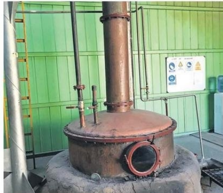
LA CINTA ESTARÁ CENTRADA EN LA PRODUCCIÓN ARTESANAL DEL PISCO.