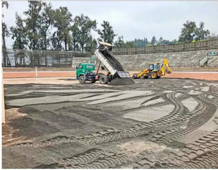
Diversos trabajos se realizaron en la medialuna monumental de Curicó.