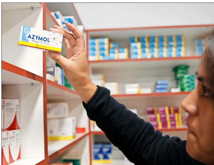
Para los expertos, un gasto importante está vinculado con el costo de los medicamentos, aunque la brecha es amplia según el tipo de aseguramiento de las personas.

ca en que "las coberturas de aseguramiento en relación al gasto promedio hospitalario también han ido disminuyendo y, por lo tanto, eso también incide directamente en el gasto de bolsillo".