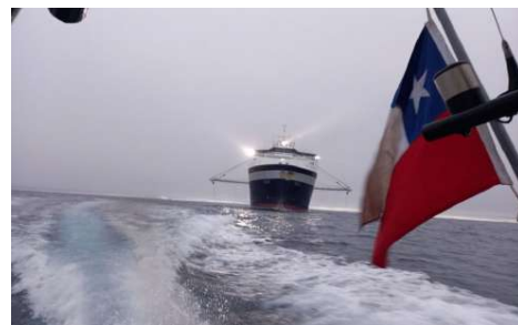
Guzmán enfatizó la necesidad de contribuir al resguardo de la soberanía y los intereses de Chile.