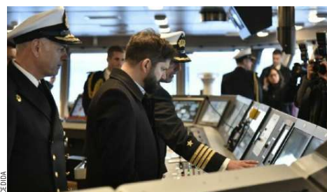
El Presidente Boric entregó el nuevo buque a la Armada. Su voluntad será clave.

El rompehielos Viel durante una de sus múltiples pruebas de mar en las aguas de la región del Biobío. Próximamente, el moderno navío será incorporado a la III Zona Naval con asiento en Punta Arenas.