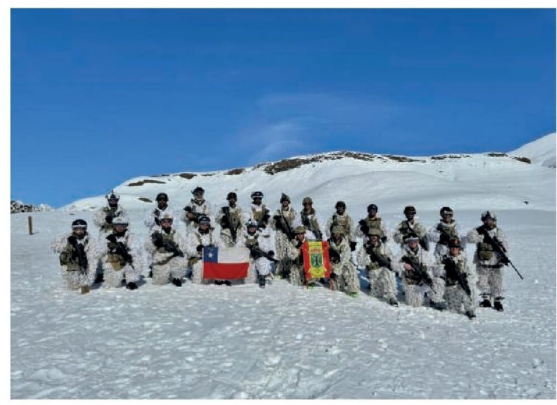
Tropas de Montaña de Chile y España en el ejercicio en Rayenco.

caminos, los sistemas de mando y control, para enlazar de forma radial al personal en terreno o los sistemas de apoyo logístico, donde resultó decisivo el empleo del ganado mular, para abastecer al personal desplegado en sus posiciones en sectores de difícil acceso. Asimismo, este tipo de adiestramiento, según indicaron desde el Destacamento, permite evaluar en forma permanente la habilidad de toma de decisiones de los comandantes de todos los niveles, a fin de permitir el cumplimiento de las tareas impuestas. De esta forma, los mandos se