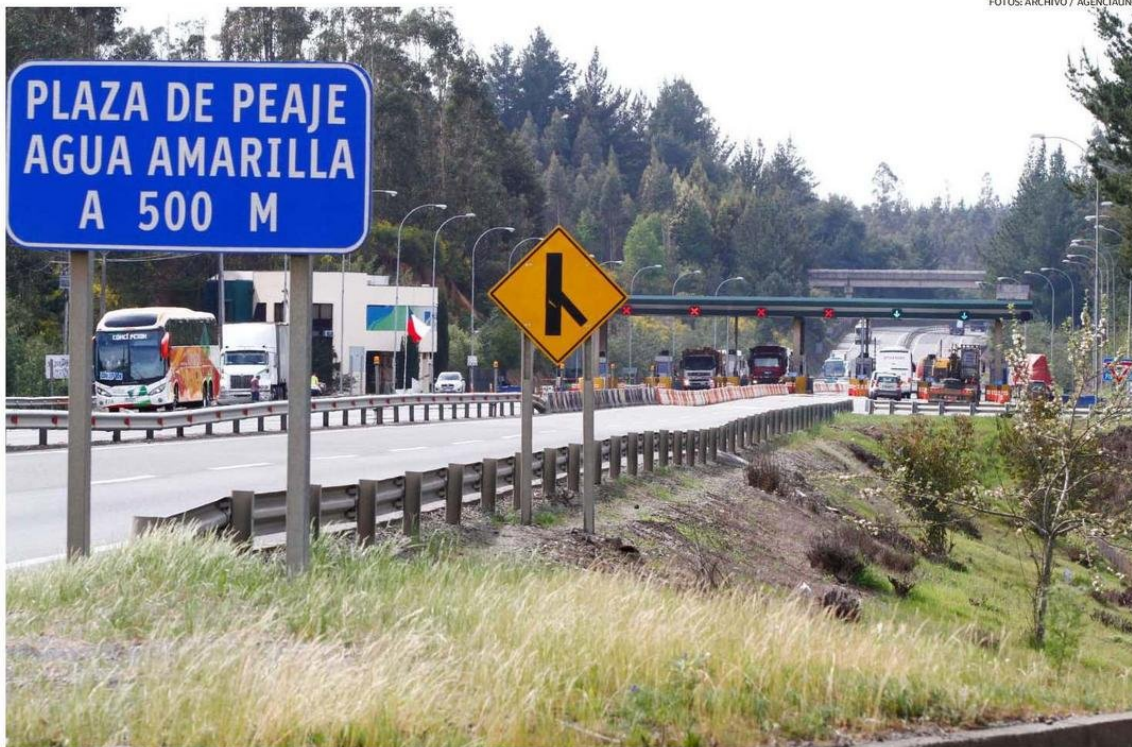
LA RUTA DEL ITATA ES LA PRINCIPAL VIA DE COMUNICACIÓN ENTRE LAS REGIONES DE ÑUBLE Y BIOBÍO. SU BUEN ESTADO ES CLAVE PARA EL TRASLADO DE PRODUCTOS.

Recientemente se anunció la licitación de estudios para el tren Concepción-Chillán-Santiago y se tomó a aquello como un buen ejemplo de la relevancia de conectar dos ciudades clave para el país.