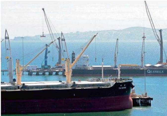
DESDE LOS PUERTOS DEL BIOBÍO SE EMBARCAN MUCHOS PRODUCTOS DE LA REGIÓN DE ÑUBLE.

Sostuvo que “nuestra Región del Biobío, en particular, se caracteriza por las actividades económicas del ámbito forestal, pesca, servicios, energía y también por ser una región portuaria. Por lo anterior, es que la constante mantención y modernización de los puntos de entrada y salida de nuestras ciudades -aeropuertos, carreteras y puertos- se vuelve fundamental por