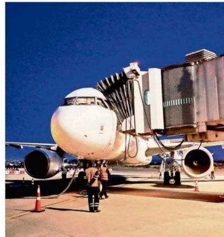
EL DESARROLLO DE CARRIEL SUR TAMBIÉN ES FUNDAMENTAL.

En ese sentido, dijo que “el poder contar con puertos cercanos, aeropuertos y carreteras de calidad, es clave no solo para dar mayor bienestar a las y los habitantes de las regiones,