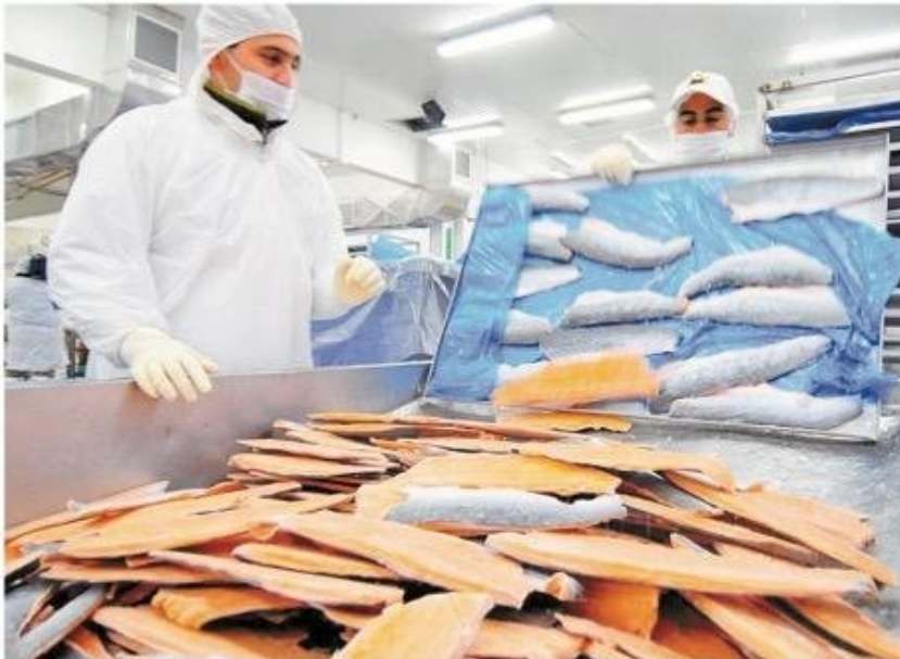
La industria salmonera es el segundo exportador de Chile.

que tiene. Somos el segundo exportador de Chile y muchos de los inversionistas no lo sabían, pero también muchos de los chilenos que asistieron tampoco lo tenían tan claro”.