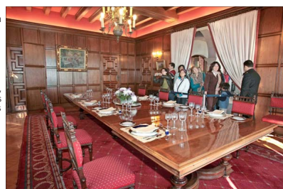
EL MUSEO DE LA HISTORIA

4. El Palacio cuenta con tres pisos y un subterráneo, y en este último se encuentran los salones, un comedor (en la foto), tres terrazas y la cocina. El primer piso incluye un sauna, gimnasio, dormitorios del personal, calderas y bodegas. El segundo piso tiene ocho piezas para el mandatario y sus visitas. El último piso, tiene una biblioteca, una sala de radio, el despacho personal del Presidente y un observatorio. En el exterior tiene una piscina, canchas de tenis y una pérgola para bailes. Actualmente en el Día del Patrimonio Cultural, las puertas del Palacio se abren para recibir visitas guiadas y conocer en profundidad la residencia y sus jardines.