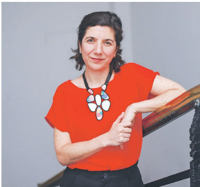
► Ministra de Ciencia, Tecnología, Conocimiento e Innovación, Aisén Etcheverry.