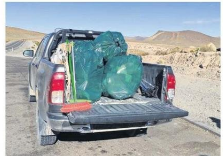
ABUNDAN LOS RESTOS DE CARGA Y DESECHOS BIOLÓGICOS

Ruta 11CH. "A la fecha hemos llegado a casi 200 choferes en 7 meses, tratando de impulsar una cultura de cuidado de parte de quienes transitan por la ruta, como no tirar basura o no dejar desechos biológicos en el camino, generando focos de contaminación que finalmente afectan el hábitat de la Reserva en la que conviven especies protegidas, en condi-