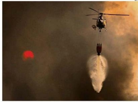
PORTUGAL ENFRENTA DEVASTADORES INCENDIOS.