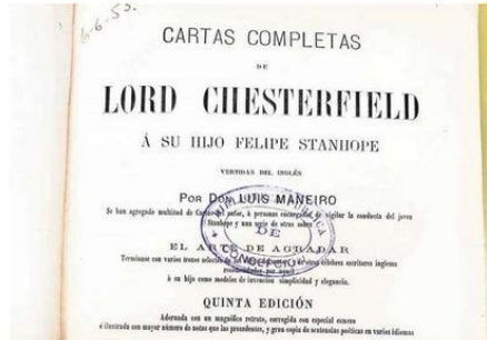
EL EJEMPLAR FUE UN ÉXITO EN EL SIGLO XIX A NIVEL MUNDIAL

DE QUÉ ERA EL LIBRO Márquez comentó que "este es un libro clásico de la literatura universal, escrito primero en inglés,