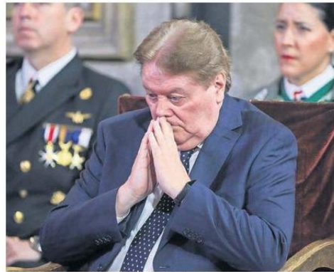
El presidente de la Corte Suprema, Ricardo Blanco.

labras del arzobispo son "un llamado contra el pesimismo y también el conformismo. Una invitación a construir caminos mediante el diálogo y la unidad para enfrentar el crimen organizado y la corrupción".