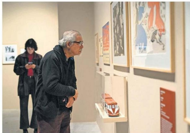
Fotografías del Archivo Fotográfico y obras de la Pinacoteca UdeC también están presente.