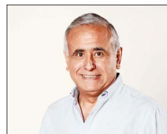
Médico intensivista, jefe de la unidad de pacientes críticos de la Clínica Indisa.