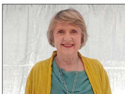
Presidenta del Colegio de Arquitectos desde 2022.