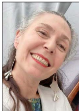
Baterista de Los Jaivas desde hace más de tres décadas.

"Érase una vez, septiembre de 1979, toda la familia, como le digo yo, la tribu Jaiva... Vivíamos todos en una misma casa, habíamos llegado hace poco a Francia, a los suburbios de París. Estábamos recién aprendiendo a hablar francés, la mayoría de nosotros, los que fuimos escolarizados rápidamente al llegar a Francia. Los demás nos iban siguiendo con este nuevo idioma que estábamos aprendiendo."