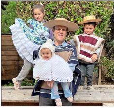
Rector de la Pontificia Universidad Católica.

"Hace unos 12 años, cuando estaban todos mis hijos viviendo en Chile y mi hija mayor aún no se casaba, tuvimos una seguidilla de dos o tres años con Fiestas Patrias de muchos juegos chilenos con vecinos y amigos. Hicimos alianzas, con competencias que iban desde tirar la cuerda, hacer carreras de ensacados, el huevo en la cuchara, buscar un dulce en un plato con harina, trompo, todas esas cosas que se juegan para estas fechas. Pero todo muy bien organizado, eran concursos, había premios, había distintas categorías y era muy entretenido. Hacíamos un asado a la hora de almorzar y después, nos poníamos a jugar (...). Estaba ese espíritu competitivo, pero competitivo en buena. Éramos todos pares, todos niños. Igual siempre uno le quería ganar al hijo mayor en la carrera de ensacados, lo que era imposible, pero