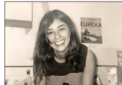
Escritora y periodista, autora de "Cosas que nunca te dije", entre otras obras.

"Recuerdo la fonda que inventamos con mi hermana en Brooklyn, Nueva York, cuando no había ningún lugar donde zapatear el 18; (fue a mediados de 2009) le pusimos Fonda York. Empezamos en un bar de unos uruguayos en Williamsburg, conseguimos pisco, vino, hicimos empanadas, tocamos músicos, DJ con música chilena contemporánea, desde la 'Cumbia triste', de Jorge González, a Los Tres, todo entre amigos artistas."