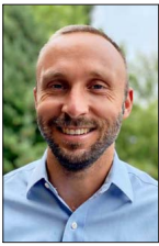
Director ejecutivo de Corporación Ciudades y exdirector del Parque Metropolitano.

"Siempre recuerdo con mucho cariño los '18' que pasé en el Parque Metropolitano de Santiago, primero porque justamente en esta época, igual como en muchas áreas verdes, florece todo el trabajo que uno desarrolla sobre todo durante el invierno, de poda, de plantación, digamos, todo rinde fruto."