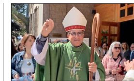
Arzobispo de Santiago desde el año pasado.

"Son bonitas experiencias, las recuerdo con cariño. Ahora viene la otra etapa de disfrutar, de aprovechar a los sobrinos. Ya todos estamos un poco más grandes, así que la etapa se vive ya enfocada en los niños, como en ese tiempo se vivía enfocada en nosotros, cuando éramos los niños".