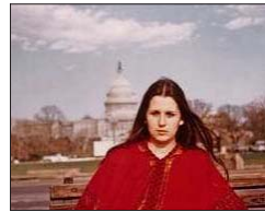
Astrónoma, premio nacional de Ciencias Exactas en 1997.

"Edith Piaf, Violeta Parra y Margot Loyola fueron tres mujeres inspiradoras en nuestra infancia; aprendimos de Chile un 18 bailando con Margot".