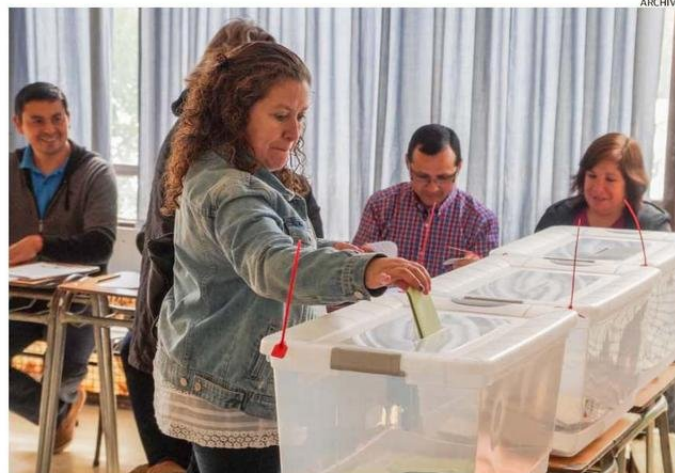
LAS ELECCIONES SERÁN EL 26 Y 27 DE OCTUBRE CON VOTO OBLIGATORIO PARA MAYORES DE 18 AÑOS.

mayores de 18 años son las que están validadas por el Servicio Electoral (Servel) en la provincia para sufragar obligatoriamente durante las elecciones de octubre.