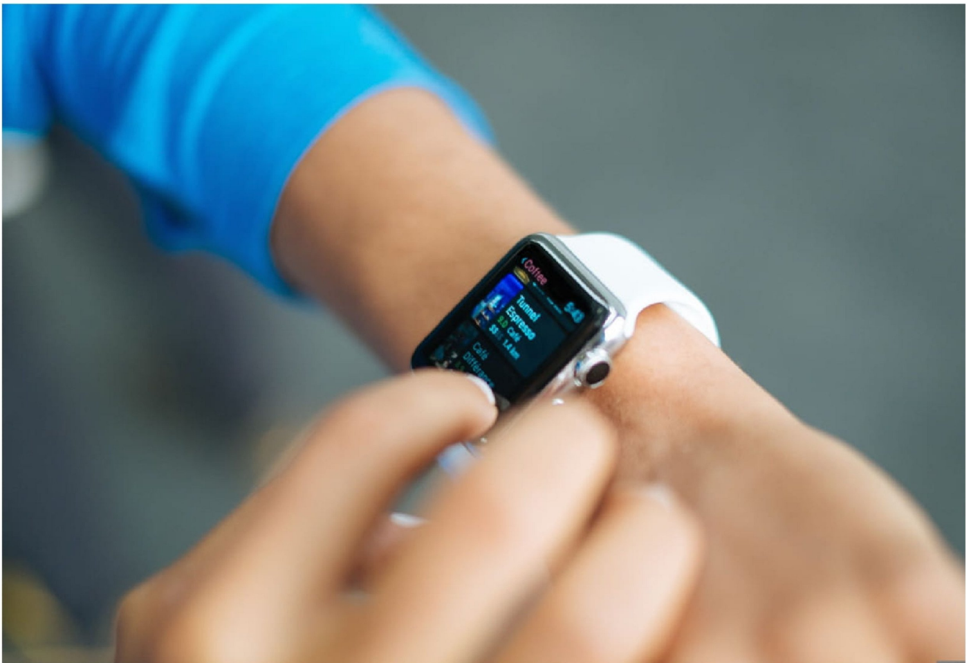
► Apple añadirá la función de detección de apnea a través de sus relojes inteligentes: los Apple Watch Series 9, 10 y Ultra 2.

“Cada 30 días, el Apple Watch analizará los datos de las alteraciones en la respira-