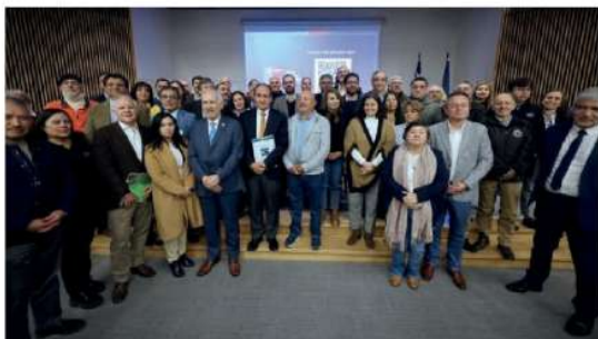
PRESENTACIÓN de las 32 medidas del Plan de Fortalecimiento Industrial del Biobío.

Eje 5: Recuperación en el mediano plazo de la producción nacional de acero *Plan nacional de acero verde 2030