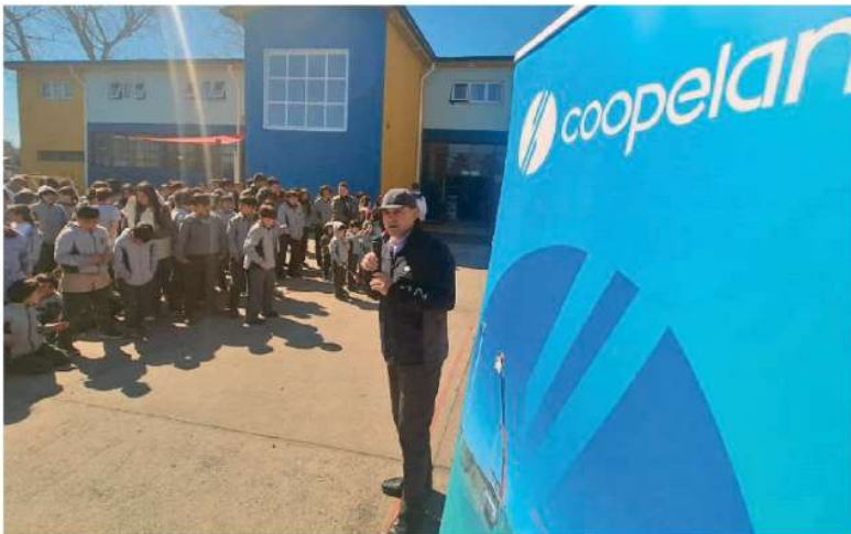
La campaña de Coopelan se realiza en las escuelas rurales dentro del área de influencia de la Cooperativa.

abarca a 35 mil clientes en las comunas de Los Ángeles, Santa Bárbara, Quilleco, Mulchén y Laja, cuyas redes de distribución de energía eléctrica suman cerca de 4 mil kilómetros.