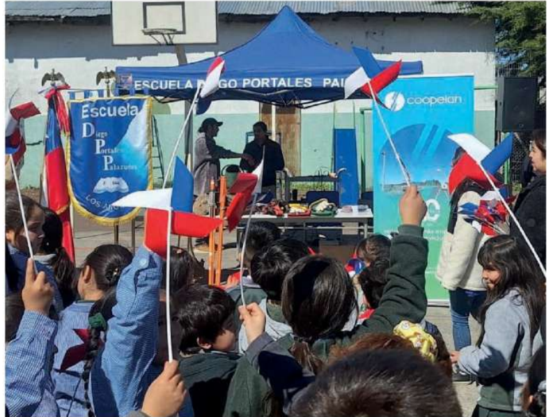
Representantes de Coopelan entregaron recomendaciones para un uso seguro de los volantines.

Especial acento se puso en no utilizar hilo curado que, ade-