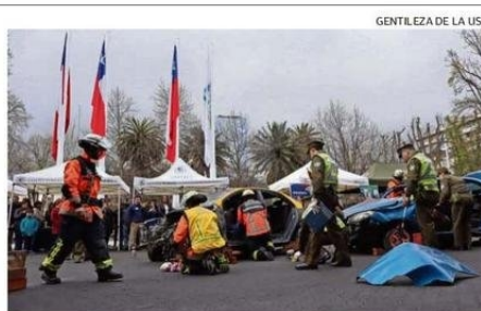
LA JORNADA TUVO LUGAR EN LA PLAZA ANÍBAL PINTO.