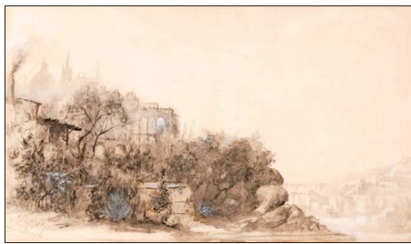
Paisaje inglés. Manuel Aldunate. 1890. Tinta negra y acuarela.

Atendiendo a esta precisión, el inventario del MNBA incluye más de 800 piezas de dibujos que datan desde las últimas décadas del siglo XV hasta hoy. Por tradición, la institución divide este patrimonio en dos secciones: una dedicada al dibujo chileno y otra al dibujo extranjero. En el libro que presentamos hemos seleccionado aquellas piezas directamente vinculadas a un ámbito geográfico occidental, excluyendo las obras de origen asiático, en particular chino, japonés e indio. Y para lo que se refiere al marco cronológico, nos hemos centrado en el siglo XIX por obvias razones ligadas a la implantación de la enseñanza del dibujo en Chile, que, como se de-