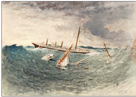
Naufragio. Thomas Sommerscales. ca. 1882. Lápiz grafito, acuarela y gouache.