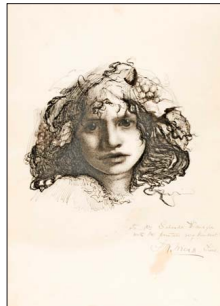
Bacante. Autor sin identificar. 1896. Tinta negra con pluma y pincel.

"A veces, debido a la fragilidad de los soportes de los dibujos, se hace difícil exponerlos y de una manera prolongada; basta con pensar por ejemplo en Apolo, personificación de las Bellas Artes de Jules-Élie Delaunay, donado al museo por Pedro Lira en 1890, cuyo soporte es extremadamente delicado. Esperamos que un día, junto con el MNBA, podamos organizar una exposición integralmente dedicada al dibujo con aquellos ejemplares que por cuestión de conservación puedan ser expuestos, y que posiblemente abarque desde el siglo XIX hasta nuestros días".