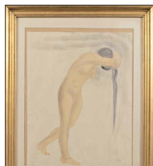
Desnudo. Atribuido a Auguste Rodin, ca. 1890. Acuarela y lápiz grafito.