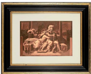
Dido y Eneas. Ernst Kirchbach, Alemania, ca. 1870. Óleo sobre papel.