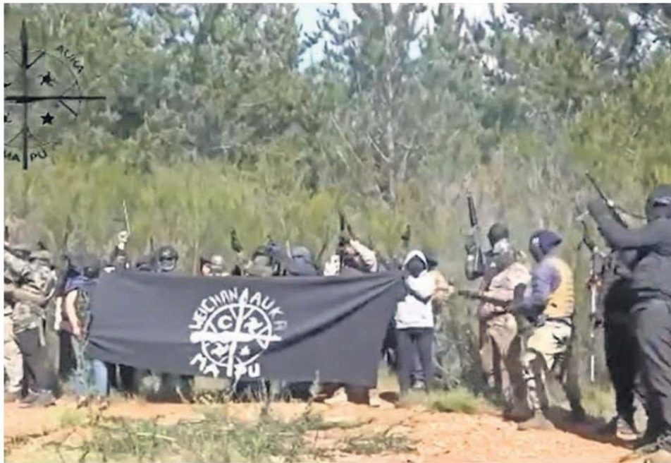
La WAM ha estado presente en la zona hace una década y hace 3 años difundieron un video mostrando su poder de fuego.