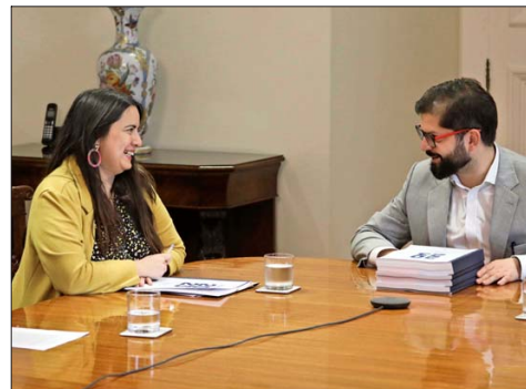
La jefa de la Dipres, Javiera Martínez (en la foto), gana un sueldo bruto de $10,6 millones, mientras el Presidente Gabriel Boric, $9,1 millones.

En el marco de esas sesiones, según se desprende de la publicación realizada en el Diario Oficial, algunos expertos plantearon la conveniencia de regular la dedicación exclusiva con el fin de prever posibles conflictos de intereses y lograr un mejor de-