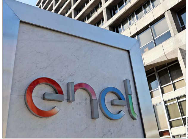
DESDE EL GOBIERNO.— señalaron que, además, se abre una arista penal para Enel producto del incumplimiento de la Ley de Electrodependientes.