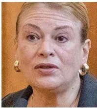
Ángela Vivanco , la ministra de la Suprema fue suspendida de su cargo y se abrió un cuaderno de remoción.