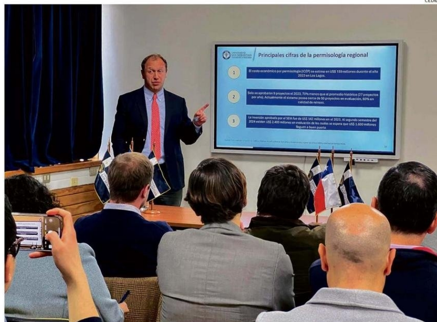
EN LA SEDE DE LA PATAGÓNIA DE LA USS, TUVO LUGAR LA EXPOSICIÓN DEL ÍNDICE DE COSTO ECONÓMICO POR PERMISOLOGÍA.

"Eso significa que más de la mitad de los recursos que estaban en tramitación no llegaron a puerto, porque el Estado se demoró más de lo que la pro-