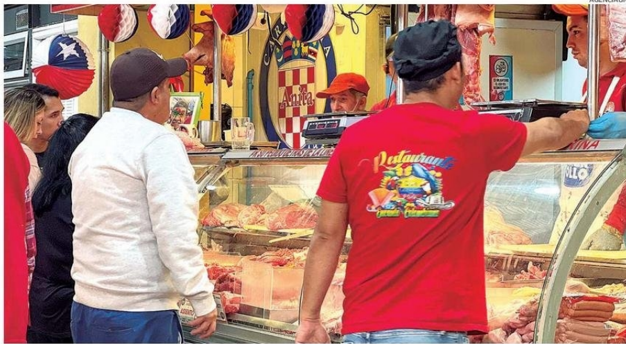
A PARTIR DE LOS $30 MIL SE PUEDE ACCEDER A UN MENÚ DIECIOCHENO.

El prototipo de canasta para cuatro personas que, en su primera opción de $30.400, cuenta con cortes de Huachalomo por $9.500, chuleta veta-