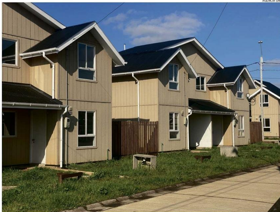
LAS POLÍTICAS PÚBLICAS PARA ACCEDER A LA VIVIENDA DEL ESTADO NO TIENEN COSTOS ASOCIADOS A GESTIÓN Y MENOS PARA LOS DIRIGENTES.

te tipo, donde familias que llevan años intentando tener su vivienda se han encontrado con comités donde se cobran montos por cada una de las reuniones que realizan los dirigentes, cuotas de incorporación que en algunos casos superan el millón de pesos, sumado a actitudes de amedrentamiento y amenazas de quedar fuera de los comités y perder la opción de acceder al beneficio habitacional si no pagan los montos impuestos. Estas irregularidades han sido descubiertas en otras comunas del país, donde incluso los dirigentes fueron denunciados por el Servicio de Vivienda y Urbanismo (Serviu) ante la