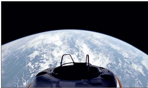
Imagen de la Tierra desde la cápsula Dragon a una altura de 1.216 kilómetros, a menos de 200 kilómetros de llegar a la altura máxima de la misión.

La cápsula Dragon lleva cuatro tripulantes, quienes se exponen a alta radiación debido a la gran distancia de la Tierra. Las dos mujeres podrían romper un récord al ser las primeras que lleguen a 1.400 km.