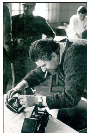
Ehrmann durante el Festival de Cine de Viña del Mar (1968).

La iniciativa de pesquisa continuará con la composición de un acervo digital, al que se accederá desde el centro de documentación universitario, y la posterior publicación de un libro que reúna algunas de las críticas que Ehrmann escribió.