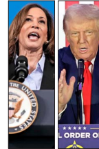
Anoche, los postulantes a la presidencia tenían su primer debate.