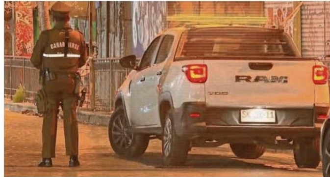
EL HECHO OCURRIÓ CERCA DE LAS 22.00 HORAS EN LA ALAMEDA CON SAN BORJA.