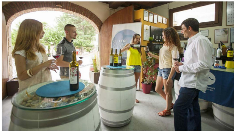
Una cata de vinos en las bodegas Cellers Baronia del Montsant en Cornudella de Montsant, Tarragona. Se trata de una bodega que elabora vinos de gran calidad, distintos y de producciones muy limitadas.

Los Aljibes es una bodega -nos dicen- enfocada y diseñada para crear vinos de alta