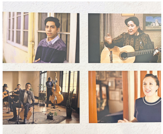
Entrevistas a personajes formados por ella también son parte de la exposición.

La muestra gráfica está disponible durante todo septiembre en el segundo piso de Mall del Centro.