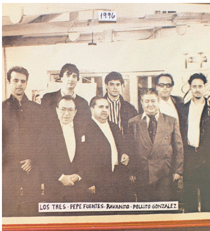
Unos jóvenes Los Tres también son parte de la muestra.