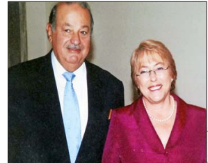
Con la expresidenta Michelle Bachelet.

a través de la adquisición de AT&T Latam por Telmex (Teléfonos de México). Ese mismo año compró Chilestat al grupo Southern Cross, dentro del “plan de internacionalización de la empresa” en ese momento.