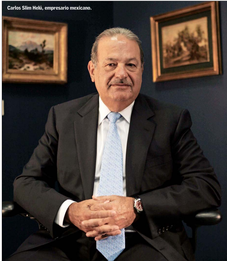
Carlos Slim Helú, empresario mexicano.

Comprar Wom sería su tercer gran hito en Chile. El primero fue la entrada en 2004,