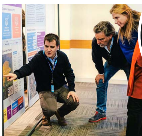
Ejecutivos de Cenco Malls explicaron en detalle el proceso de Participación Ciudadana Temprana, que duró cuatro meses.