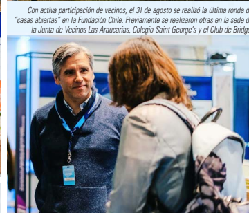
Con activa participación de vecinos, el 31 de agosto se realizó la última ronda de "casas abiertas" en la Fundación Chile. Previamente se realizaron otras en la sede de la Junta de Vecinos Las Araucarias, Colegio Saint George's y el Club de Bridge.