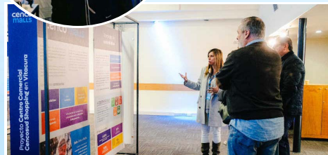
También hubo una presentación general de la compañía a los vecinos.