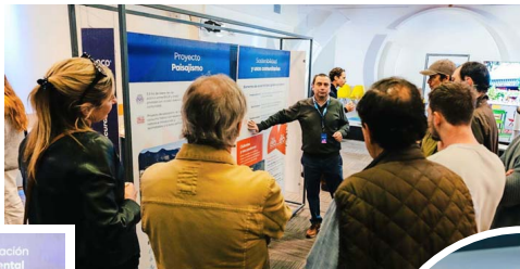
Parte de la presentación incluyó detalles del paisaje que incorporará el proyecto.