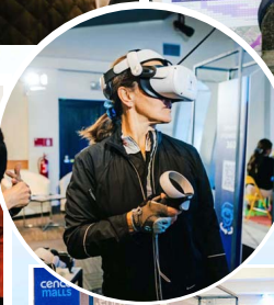
Los asistentes a las "casas abiertas" también pudieron conocer el proyecto a través de realidad virtual.