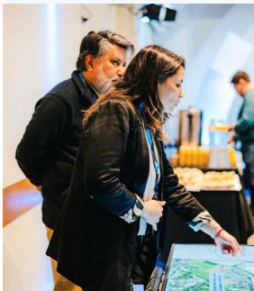
Equipo y asesores de Cenco Malls mostraron en detalle la propuesta vial, aprobada en julio pasado por la autoridad.