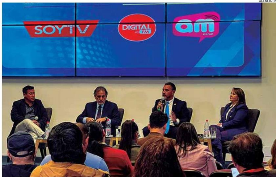
EL DEBATE SE REALIZÓ AYER EN EL AUDITORIO DE EL MERCURIO DE ANTOFAGASTA Y FUE TRANSMITIDO POR SOYANTOFAGASTA Y OTROS MEDIOS.

La doctora cree que se deben generar incentivos para que la región pueda contar con más especialistas, y de