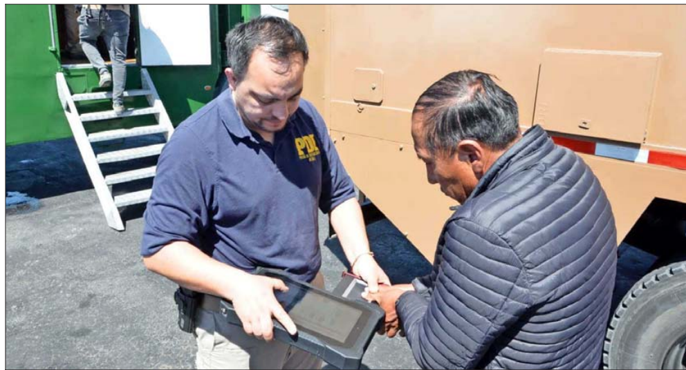
INVERSIÓN. — Cerca de US$ 6 millones le costó implementar el sistema al Gobierno Regional de Arica.